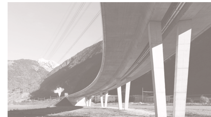
MEP 2006 | Réalisation 2010-2012 | Budget CHF 12'500'000.- | Ingénieurs INGPHI SA

Viaduc sur l'A9 à Rennaz Service des routes du canton de Vaud (MO)