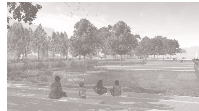
Concours 2009 | Réalisation 2017 | Budget CHF 5'000'000.- | Arch.-Paysagistes Hüsler & Associés

Parc public du Reposoir à Nyon Ville de Nyon (MO)