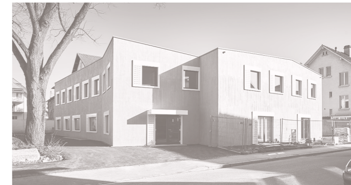
Concours 2011 | Réalisation 2015 | Budget CHF 5'000'000.- | Architectes Translocal

Foyer Petit Maître à Yverdon-les-Bains Fondation Petit Maître (MO)