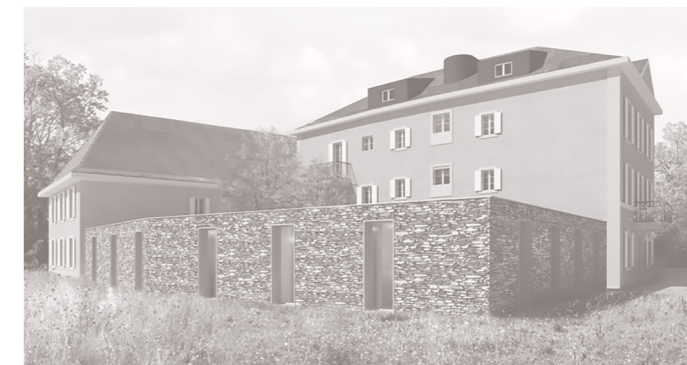
MEP 2012 | Réalisation 2013-2015 | Budget CHF 7'000'000.- | Architectes Stähelin

Fondation Saint-George à Yverdon-les-Bains Fondation Saint-George (MO)