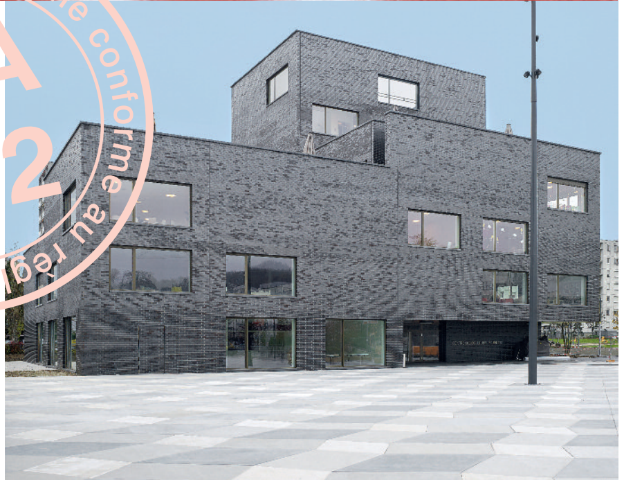
Centre socio-culturel d'Ecublens, Al30 architectes Sàrl. Concours d'architecture à un degré en procédure ouverte, certifié SIA 142, 2008. Maître de l'ouvrage: commune d'Ecublens.

LES MANDATS ADJUGÉS AUX INGÉNIEURS ET AUX ARCHITECTES CONCERNENT UNE CATÉGORIE DE SERVICES PARTICULIÈRE: LES PRESTATIONS INTELLECTUELLES. LEUR MISE EN CONCURRENCE ET LEUR ÉVALUATION NE PEUVENT PAS SE FONDRE PRIORITAIREMENT SUR LE PRIX, COMME C'EST LE CAS DANS LE CADRE D'UN MARCHÉ DE FOURNITURES. MAIS AU CONTRAIRE SUR DES CRITÈRES DE QUALITÉ SPÉCIFIQUES. D'OÙ L'IMPORTANCE DU CHOIX DE LA PROCÉDURE DE MISE EN CONCURRENCE.