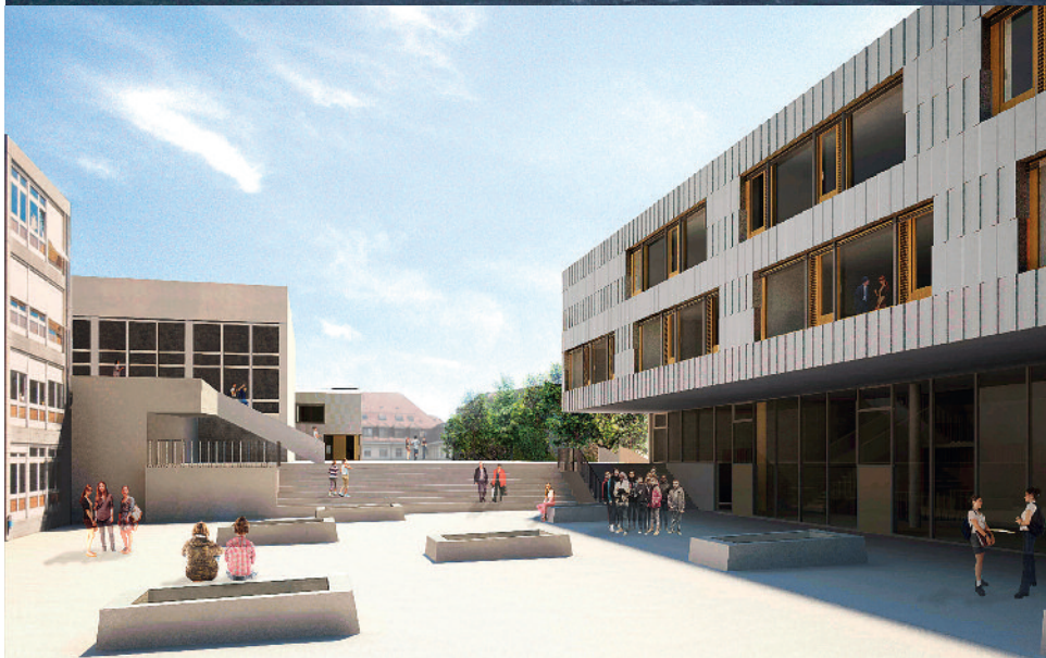
Photo du haut: Complexe communal et déchèterie de St-Prex, Pont 12 architectes. Concours d'architecture à un degré en procédure ouverte, 2007. Maître de l'ouvrage: commune de St-Prex.