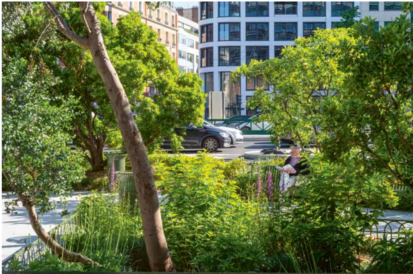
Nadia Herbreteaux (Ilex) présente les aménagements paysagers des Allées de Neuilly (F) : l'abondance végétale incite à s'approprier les lieux, à adapter les comportements et, en conséquence, apporte une diminution réelle du niveau sonore (environ 3 dB de moins).