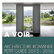
A VOIR ARCHITECTURE ROMANDE PETIT GUIDE 2015 - 2016

en librairie ou sur commande: info@vd.sia.ch